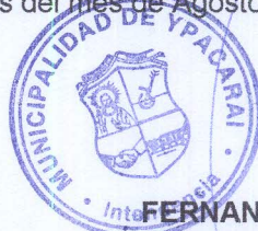
FERNANDO NEGRETE INTENDENTE MUNICIPAL

SAN EXPEDITO Consultora RUC 1513152 - 1 SAN EXPEDITO CONSULTORA CONTRATISTA